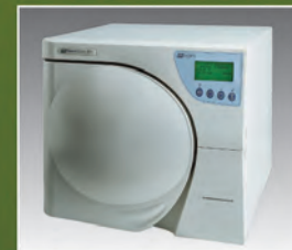
Millennium B+. 17 litros