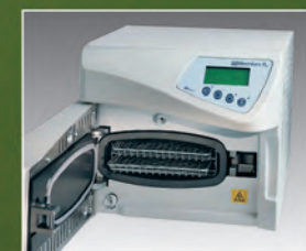
Millennium micra. 5,5 litros