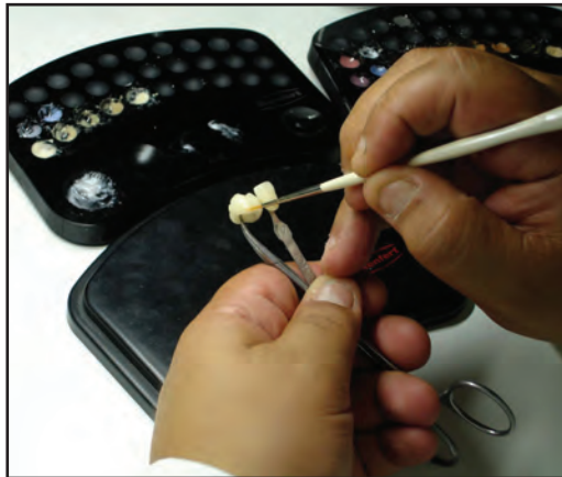
Nos workshops sobre a nova cerâmica injectável NobelRondo™ Press para Técnicos Laboratoriais de Prótese Dentária