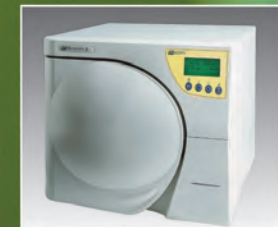
Millennium B. 17 litros