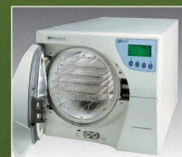
Millennium B2. 21 litros